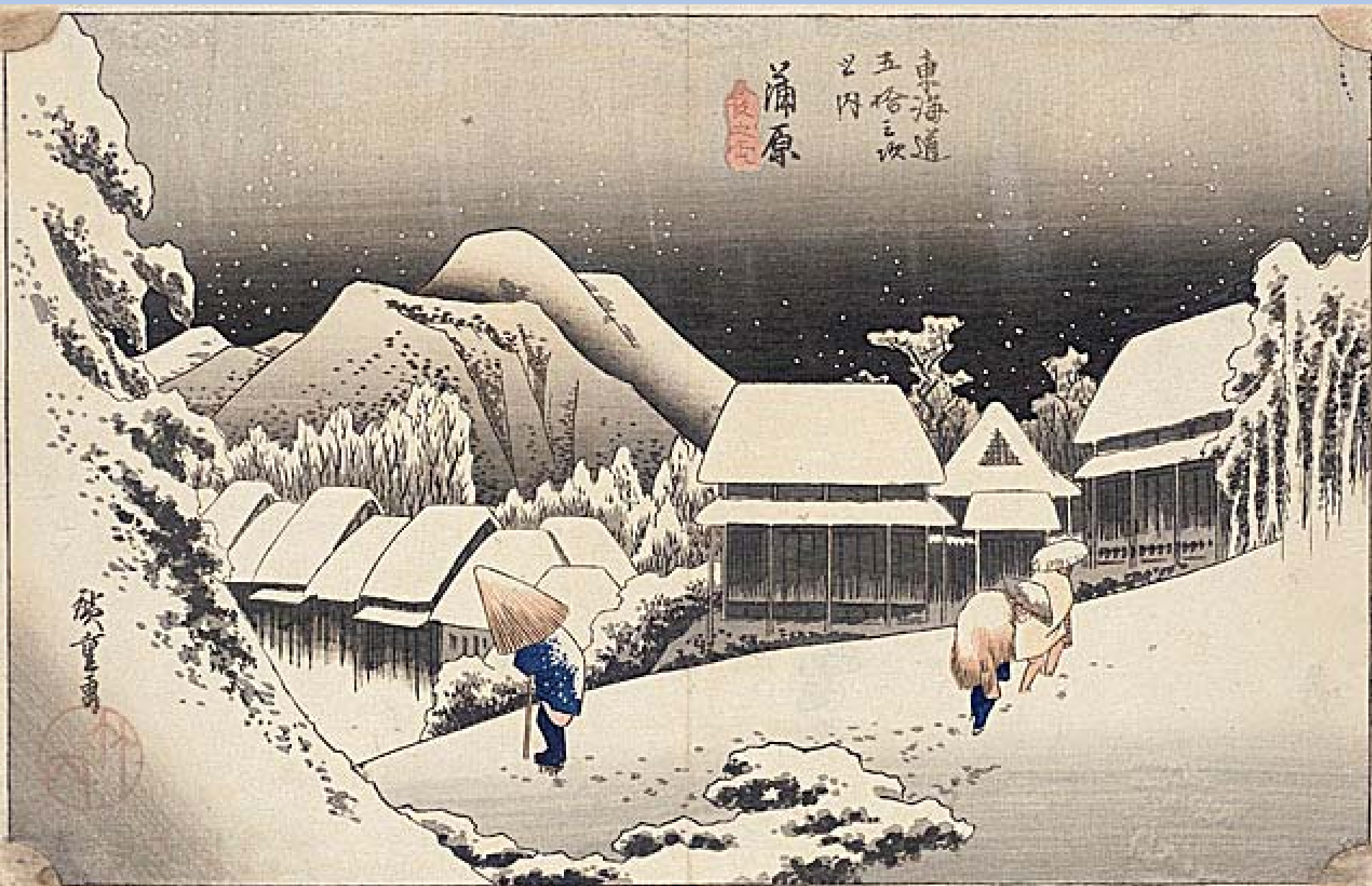
Hiroshige, "Kvällsnö vid Kambara"