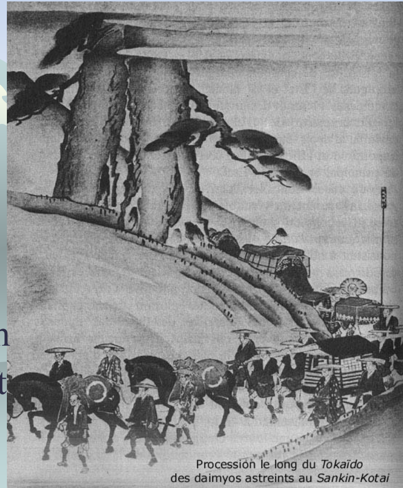
Procession le long du Tokaido des daimyos astreints au Sankin-Kotai